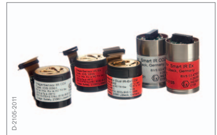
Sensores Infrarrojos Dräger IR