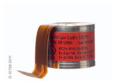
Sensores catalíticos Dräger