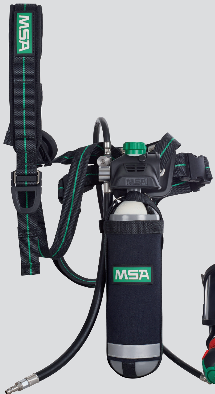
PremAire Combination con 3S PS-MaXX y AutoMaXX-AS