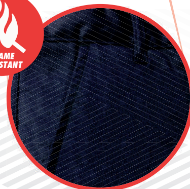
Tela resistente al fuego Fyrban FRC