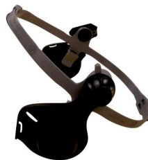
Adaptador para Casco Speedglas 9100

La máscara auto-oscurecible Speedglas 9100 brinda la opción de ser usada con casco de seguridad, mediante un adaptador, el cual se ajusta a la mayoría de los cascos.