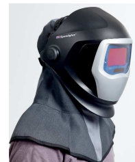
Capucha para soldar Teca-Weld