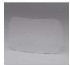
Placa de protección exterior speedglas 9100 standard con protección resistente a los rayones