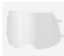
Visor para esmerilado antiempañante