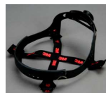
Sistema de suspensión