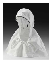
Cubierta para cabeza, cuello y hombros para modelo M-307