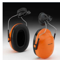
Fonos para casco 3M Peltor compatible con M-307 NRR=24dB