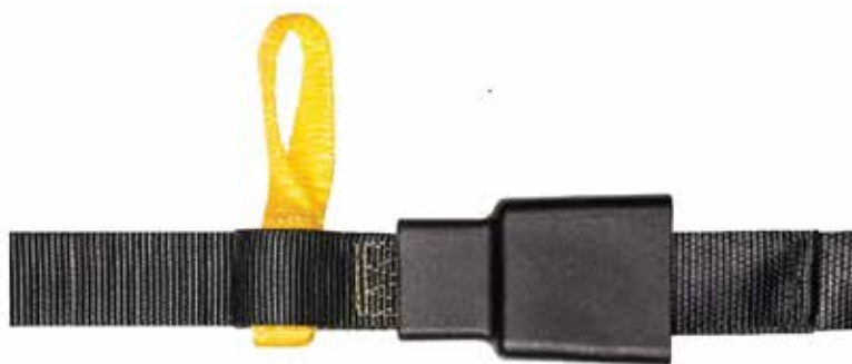
Accesorios opcionales: cintas para amarre y cubiertas de plástico en herrajes