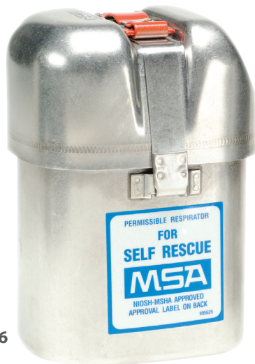
Autorrescatador W65 No. de parte 455696