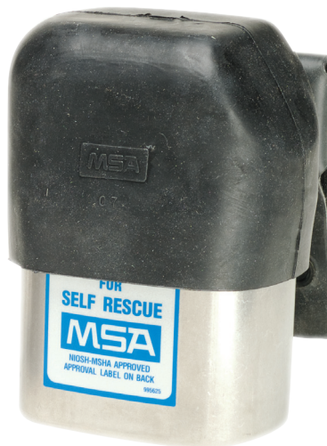
Botella protectora de hule negro para Autorrescatador W65 No. de parte 449428